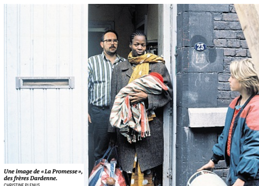
Une image de « La Promesse », des frères Dardenne.