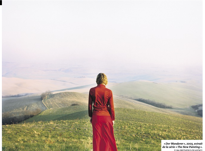
« Der Wanderer », 2003, extrait de la série « The New Painting ». ELINA BROTHERUS/GB AGENCY

La promesse d'émancipation s'exprime aujourd'hui en France à travers une variété de résistances et d'aspirations à la justice sociale, à la dignité personnelle, à l'autogouvernement de soi et des collec-