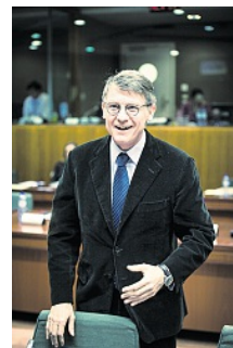
Vincent Peillon.