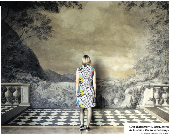
« Der Wanderer », 2004, extrait de la série « The New Painting ».

La publication des séminaires d'Alain Badiou est un travail de longue haleine, qu'ont amorcé les éditions Fayard en 2013. Cet automne paraît un nouveau volume de la « trilogie ontologique » qui prend place auprès du Malebranche (2013) et du Heidegger , qui suivra en 2015. Ce Parménide ( Parménide. L'être 1. Figure ontologique , Fayard, « Ouvertures », 264 p., 18 €), séminaire de l'année 1985-1986, part du titre de « père de la philosophie », que porte ce Grec du V e siècle av. J.-C. Philosophe, il le serait parce qu'il a convoqué la rigueur de « procédures mathémato-logiques » : « La philosophie est originellement grecque parce que les mathématiques sont originellement grecques », enseigne Alain Badiou en 1985. En vue du Forum philo Le Monde Le Mans, nous lui avons demandé ses réflexions sur le thème de la promesse.