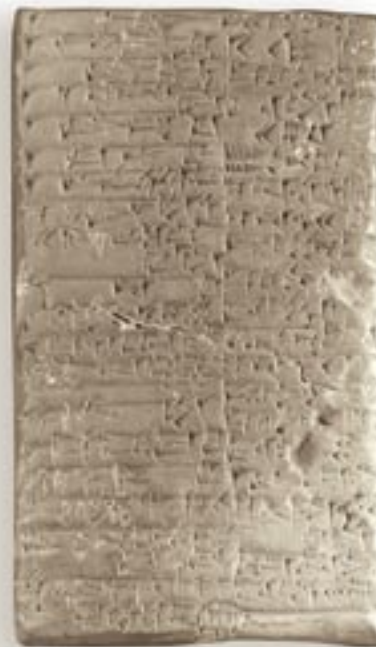
Tablette cunéiforme 3400-3500 avant J.-C. Basse-Mésopotamie.

Psychiatre et écrivain. Elle est l'auteure d'une douzaine de livres, dont La Compagnie des spectres (Seuil, 1997) et Portrait de l'écrivain en animal domestique (Seuil, 2007).