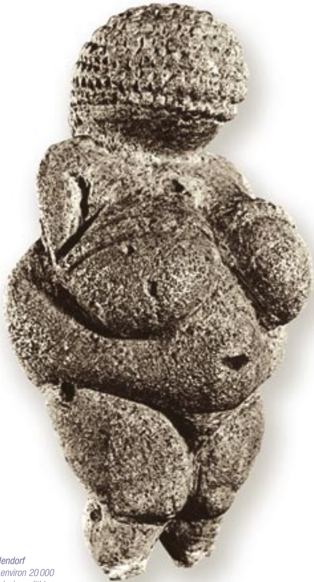
Vénus de Willendorf Gravettienne, environ 20 000 avant J.-C. Calcaire oolithique, 11 cm. (Naturhistorisches Museum, Vienne)