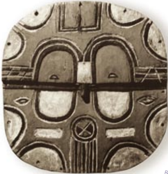
Masque Bois peint, 32,7 cm Ba-Teke (Congo).