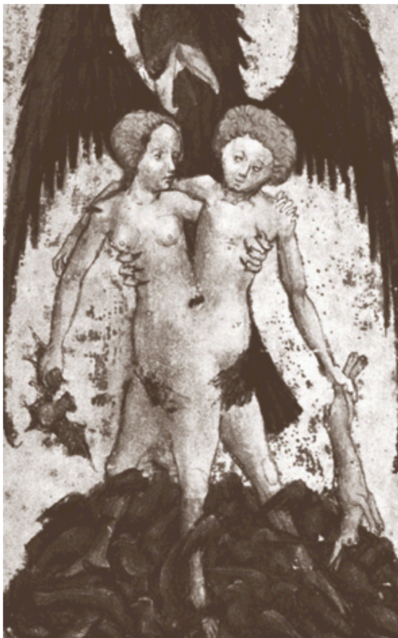
Androgyne, créature du symbolisme alchimique