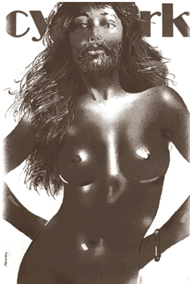
Cirque Affiche de Waldemar Swierzy

Depuis les années 1830, l'idée d'un « troisième sexe » s'est constituée comme un objet de réflexion théorique en Europe, aussi bien d'un point de vue littéraire que scientifique, au point de devenir un outil très pertinent dans les débats sur la différence des sexes – et l'élaboration de leur définition. Quelles sont les figures qu'incarne au quotidien ce « troisième sexe », les discours qu'il suscite, les déplacements qu'il provoque ? Quelles sont, surtout, ses prolongements contemporains dans la construction d'un hypothétique « troisième genre », aussi bien en France qu'aux Etats-Unis, à l'heure du transgenre et de la théorie queer ?