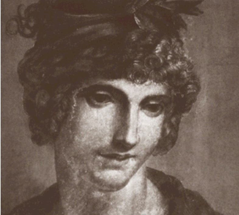
Olympe de Gouges - Anonyme, 1784, Aquarelle, Musée Carnavalet

systématiquement masculins ( chaton, chiot, lapereau, marcassin, éléphanteau, girafon... ), excepté... dans les cas avérés d'élevage ( velle, pouliche, agnelle, chevrette )!